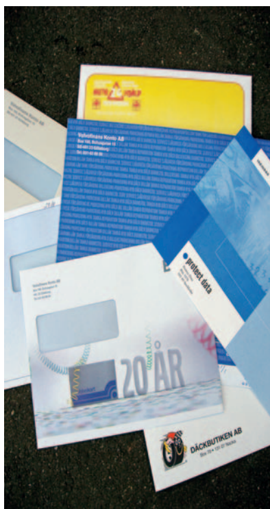
Exempel på kuvert som Bording trycker.