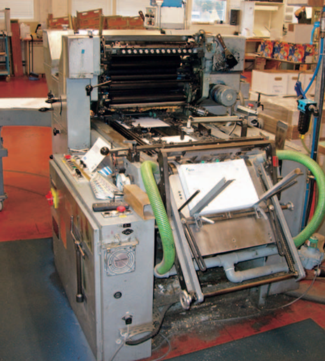
Kuvertpressen är en Winkler&Dünnebier. De två färgverken är staplade på varandra vilket gör att den tar väldigt lite plats.